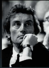
Helmut Jahn Murphy/Jahn, Chicago